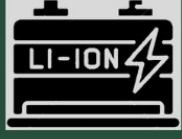
Li-Ion Batarya (LiFePO4)