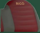
Premium konfor koltuklar