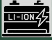
Li-Ion Batarya (LiFePO4)